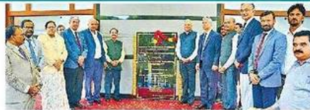
శివాలకాన్ని ఆవిష్కరించిన అతిథులు, చిత్రంలో సుప్రీంకోర్టు న్యాయమూర్తి జస్టిస్ నరసింహ, ఏపీ హైకోర్టు ప్రధాన న్యాయమూర్తి జస్టిస్ ధీరజ్ సింగ్ రాకూర్ తదితరులు

సబ్బవరం (పరవాడ), స్కూన్టుడే: అనకాపల్లి జిల్లా సబ్బవరంలోని దామోదరం సంజీవయ్య జాతీయ న్యాయ విశ్వవిద్యాలయం (డీఎస్ఎన్ఎల్ ఎల్ యూ)ను శుక్రవారం పలువురు న్యాయమూర్తులు సందర్శించారు. ఇక్కడ నెలకొల్పిన మహాత్మాగాంధీ, బి.ఆర్.అంబేద్కర్, దామోదరం సంజీవయ్య విగ్రహాలను సుప్రీంకోర్టు న్యాయమూర్తి జస్టిస్ పి.శ్రీనరసింహ.. ఏపీ హైకోర్టు ప్రధాన న్యాయమూర్తి జస్టిస్ ధీరజ్ సింగ్ రాకూర్తో కలిసి ఆవిష్కరించారు. అనంతరం అకడమిక్ బ్లాకు-2, ఇండోర్ స్టోర్స్ కాంప్లెక్స్ భవనాలను అతిథులు ప్రారంభించారు. ఈ సందర్భంగా సెమినార్ హాల్లో