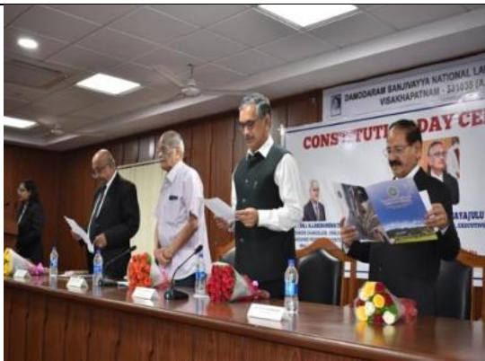
Constitution Day Celebrations – Hon'ble Sri Justice D.V.S.S. Somayajulu, Former Judge, High Court of Andhra Pradesh – Chief Guest