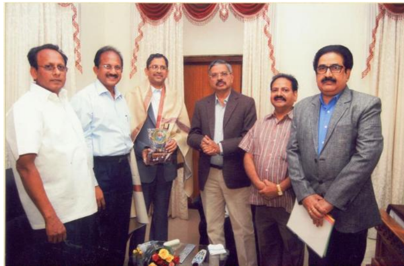
Honouring Hon. Justice, N.V.Ramana, Judge, Supreme Court of India, with Andhra University emblem in the presence of Hon. Chief Justice of India along with other University officials and Chairman, bar Council of Visakhapatnam, as Prinipal of Dr. B.R.Ambedkar College of Law, Andhra University at Visakhapatnam