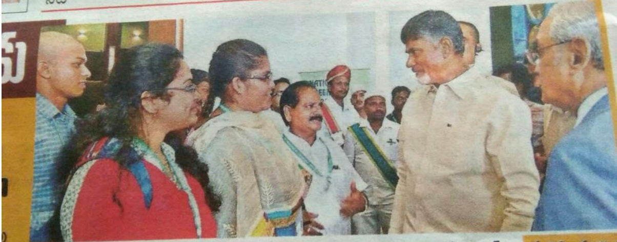
సదస్సు ప్రాంగణంలో ఎ.యు.విద్యార్థులు, ఎ.యు.న్యాయకళాశాల ప్రిన్సిపల్ ఆచార్య సూర్యప్రకాశరావుతో ముచ్చటిస్తున్న ముఖ్యమంత్రి చంద్రబాబునాయుడు మలిన్ని దృశ్యాలు 7లో