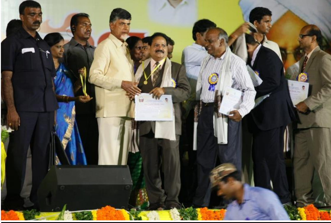
Best Teacher – 2015