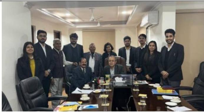
Vice Chancellor with the Law Commission of India, Chairperson and Members discussing Uniform Civil Code