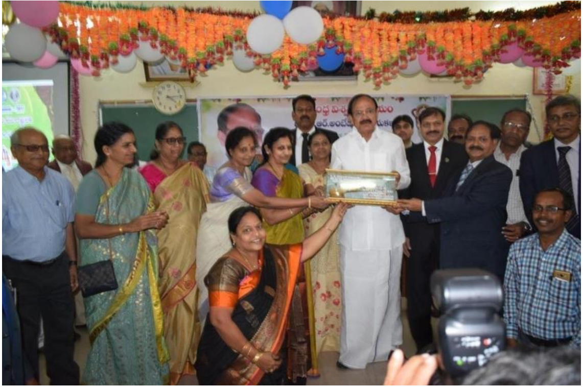
Felicitating Shri. M. Venkaiah Naidu, Honourable Vice President of India who is Illustrious Alumnus of A.U. Law College, Visakhapatnam.