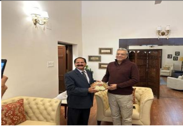
Vice-Chancellor with Hon'ble Sri Justice P. Sri Narasima, Judge, Supreme Court of India & Hon'ble Visitor, DSNLU