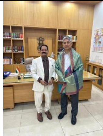
Vice-Chancellor with Hon'ble Sri Justice Dhiraj Singh Thakur, Hon'ble Chief Justice, High Court of Andhra Pradesh & Hon'ble Chancellor, DSNLU