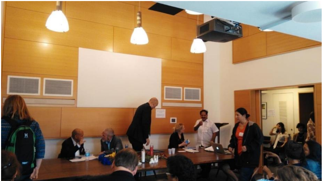
Participated in the International Seminar on "Indigenous Peoples" Rights Programme organized by Institute for the Study of Human Rights, Columbia University, New York. U.S.A. during 14th to 15th ,May 2016