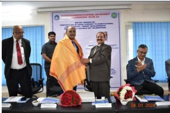
Republic Day Celebrations – Hon’ble Sri Justice Ninala Jayasurya, Judge, High Court of Andhra Pradesh – Chief Guest