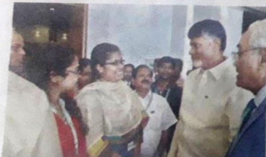
విద్యార్థులను అభినందిస్తున్న చంద్రబాబునాయుడు