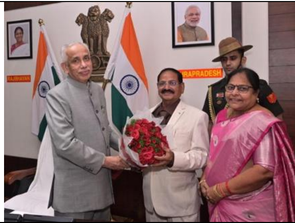
Vice-Chancellor with Hon'ble Sri S. Abdul Nazeer, Governor of Andhra Pradesh