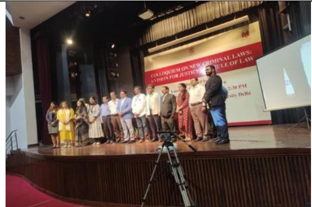
Speaking at UGC “Colloquium on New Criminal Laws: A vision for Justice and Rule of Law” at National Law University, Delhi