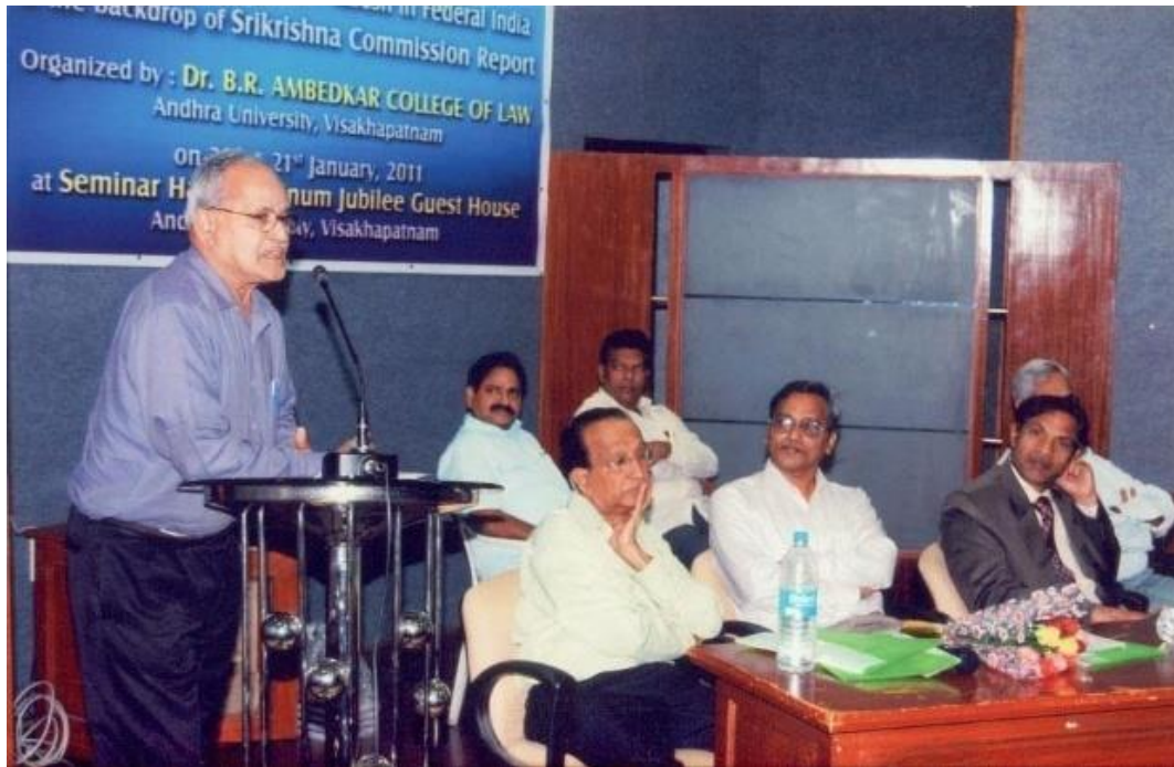
Organised UGC National Seminar on future of Andhra Pradesh in the backdrop of Justice Sri Krishna Commission report at Andhra University on 21-01-2011.