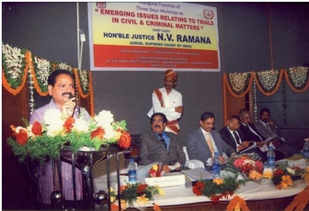
Presided the function where Alumnus of A.U. Law College