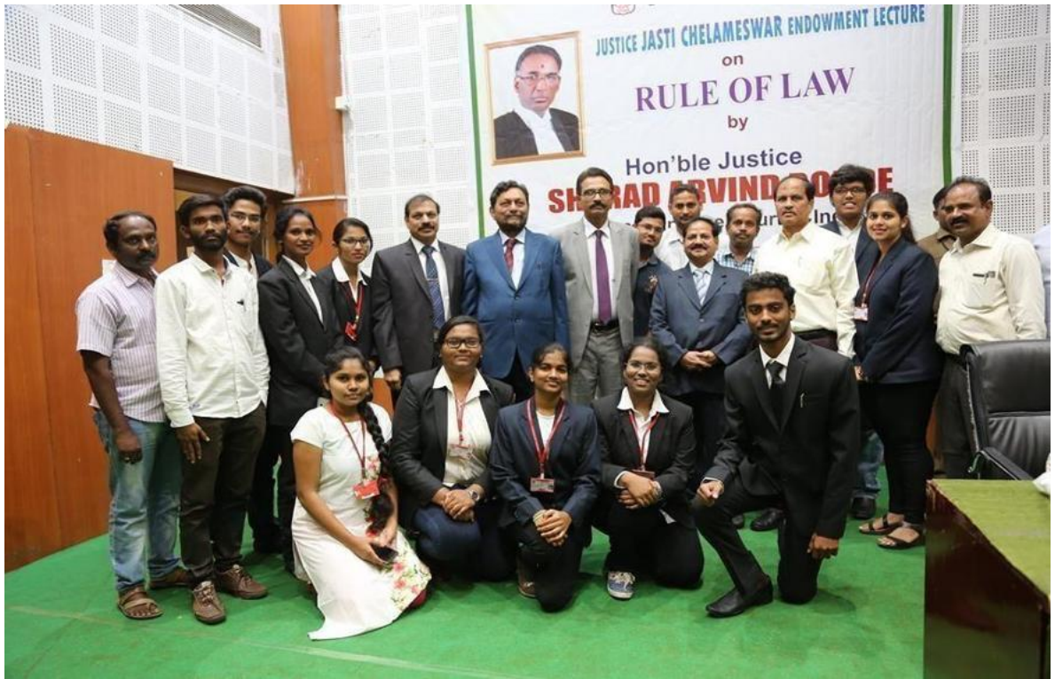
Justice Arvind Bobde (Senior Most Judge, Supreme Court of India) delivered Justice J. Chalameshwar Endowment Lecture on 17-03-2018 in Dr. B.R. Ambedkar College of Law, Andhra University.