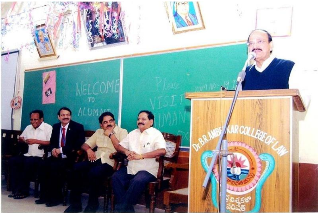
Addressing in a National workshop on "Emerging Issues Relating To Trials" in Civil and Criminal matters in which Justice N.V.Ramana, Hon. Judge, Supreme Court of India, Justice K.Chandrayya, Judge, High Court of Andhra Pradesh and Telangana, Sri. Jayasurya, Hon. District and Sri. Prof. G.S.N.Raju, Vice Chancellor, Andhra University also participated.