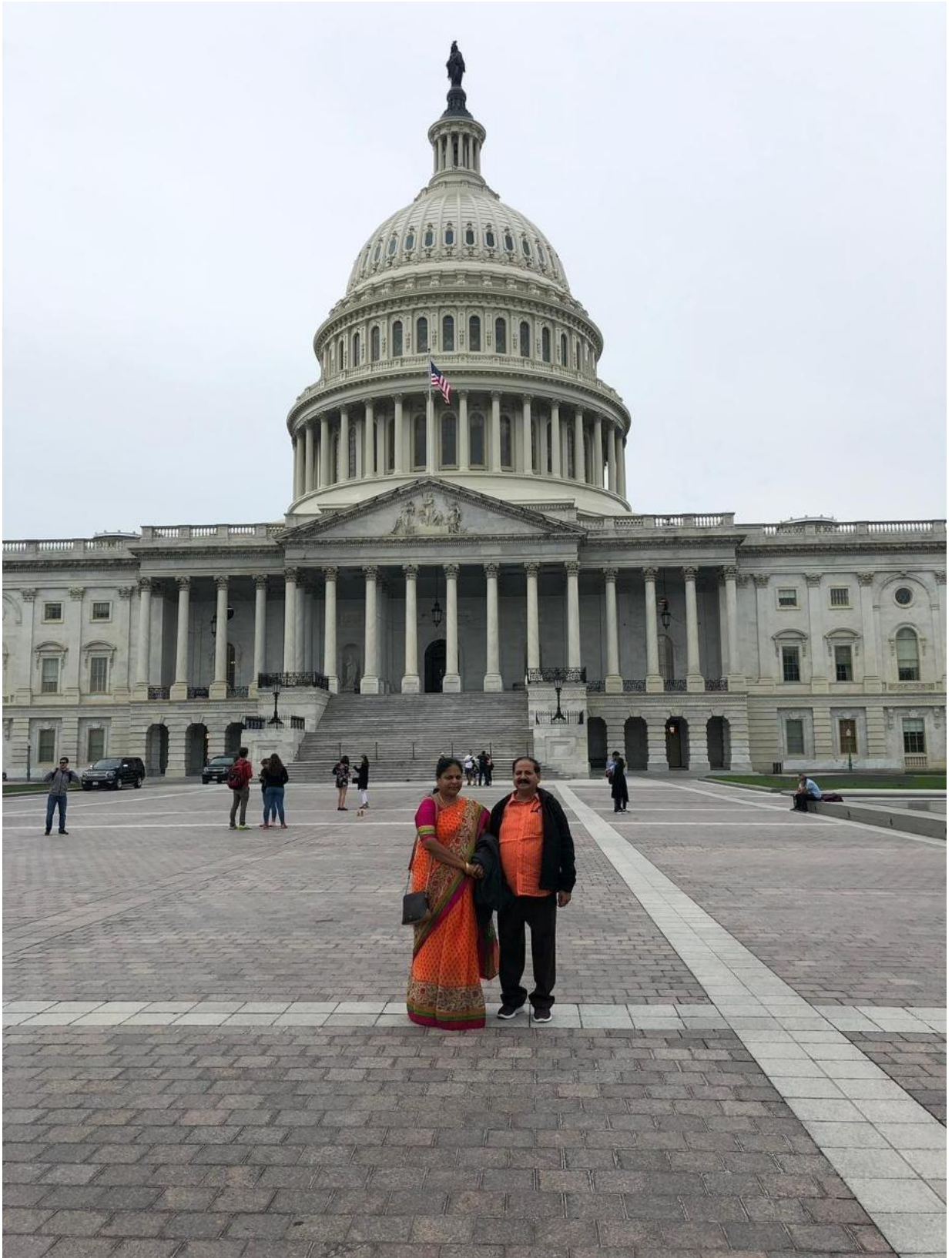
Visiting the US Capitol Building , May 2019