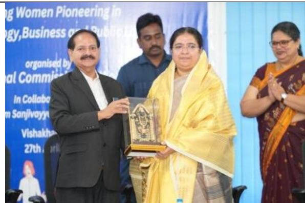
Vice Chancellor felicitating Hon’ble Smt. Justice Venkata Jyotirmai Pratapa, Judge, High Court of Andhra Pradesh who was Chief Guest in National Women Commission programme on Awareness and Women Capacity Building.